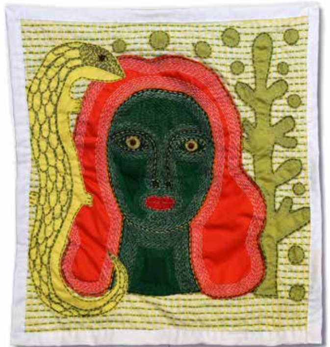
KHOLOD HAWASH Fear , 2020 käsin ommeltu kangas, 50 x 50 cm