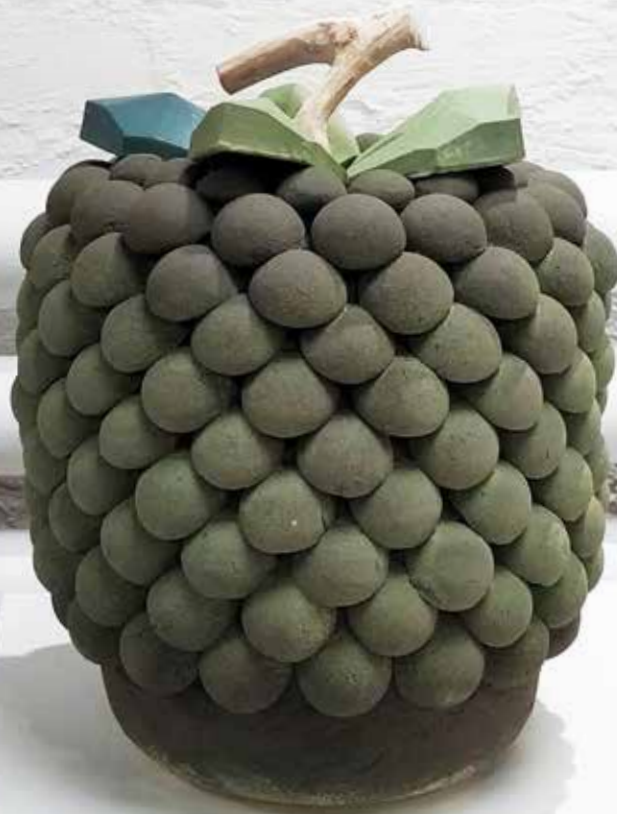
LAURA HAVANTO Kypsyvä vatukka 1, 2021 keramiikka, puu, käsinrakennettu, 25 x 30 x 25 cm