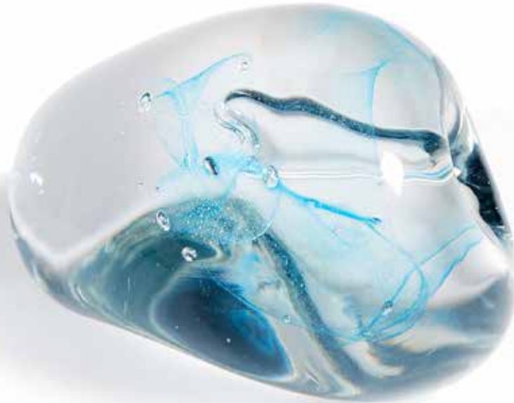
KATERINA KROTENKO Perfect Unperfection , 2019 lasi, puu, 8 x 11 cm