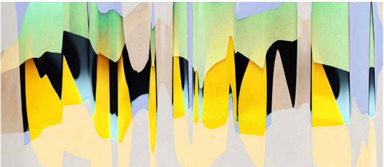
KIRA LESKINEN Ohasi , 2021 pigmenttiviedos, diasec, 43 x 100 cm

Yksi apurahansaaja ei antanut lupaa julkaista tietojaan.