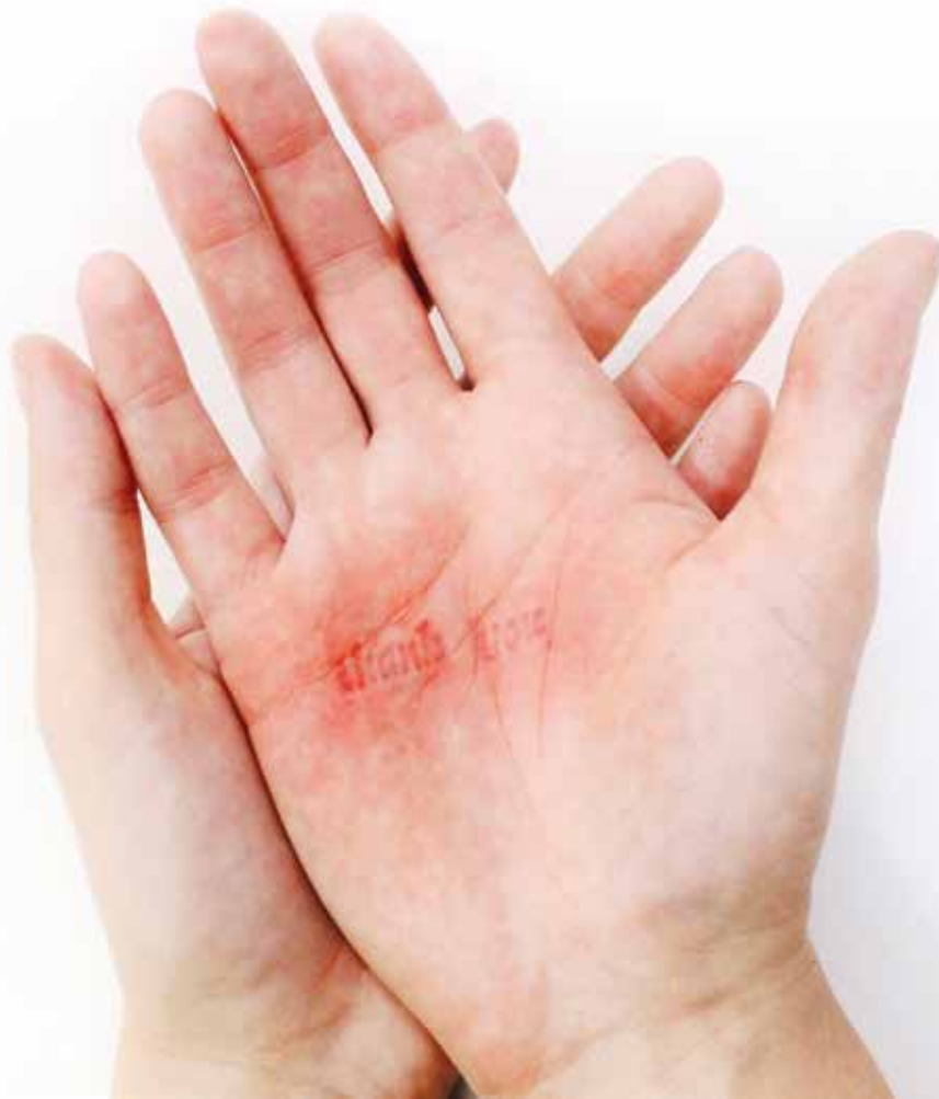
ROMA AUSKALNYTE Gratitude , 2020 valokuva, Courtesy of the artist