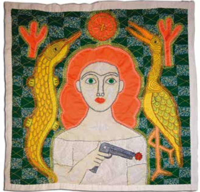
KHOLOD HAWASH Intimacy , 2021 käsin ommeltu kangas, 110 x 110 cm

Kholod Hawashin työn keskiössä on käsillä tekemisen prosessi. Hän yhdistää perinteen ja nykyisyyden hienolla tavalla ja onnistuu luomaan persoonallisen värikylläisen tarinoiden maailman.