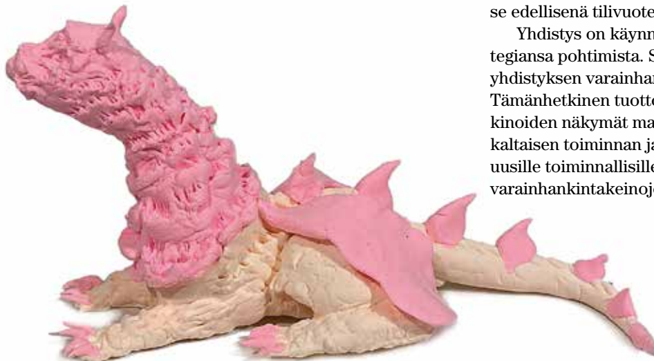
VENLA EKEBOM Vaaleanpunainen lohikäärme, 2021 Foam Clay, 9,5 x 9,5 x 19,5 cm

Yhdistys on käynnistämässä tulevien vuosien strategiansa pohtimista. Siinä yhtenä keskeisenä osana on yhdistyksen varainhankintamuotojen kehittäminen. Tämänhetkinen tuotto- / kulurakenne ja sijoitusmarkkinoiden näkymät mahdollistavat juuri ja juuri nykykaltaisen toiminnan jatkumisen, mutta eivät anna tilaa uusille toiminnallisille avauksille. Tämänkin takia uusien varainhankintakeinojen löytäminen olisi tärkeää.